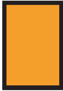
1/1 Seite 400,- Euro

Endformat 297 x 210 mm Anzeige bitte mit Anschnitt liefern (303 x 216mm)