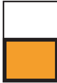
1/2 quer 250,- Euro

Endformat 297 x 210 mm Anzeige bitte mit Anschnitt liefern (303 x 216mm)